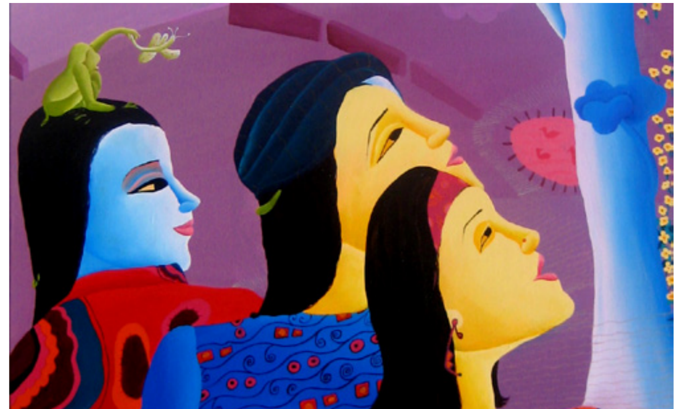
SUNANDA KHAJURIA BLUE TREE , 2009 AKRYL PÅ LÆRRED 122X69 CM