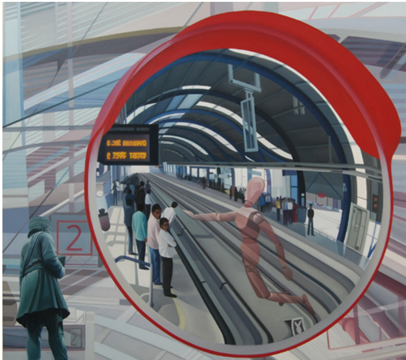
JOYDIP SENGUPTA MIRROR IMAGE , 2010 OLIE PÅ LÆRRED 153X153 CM