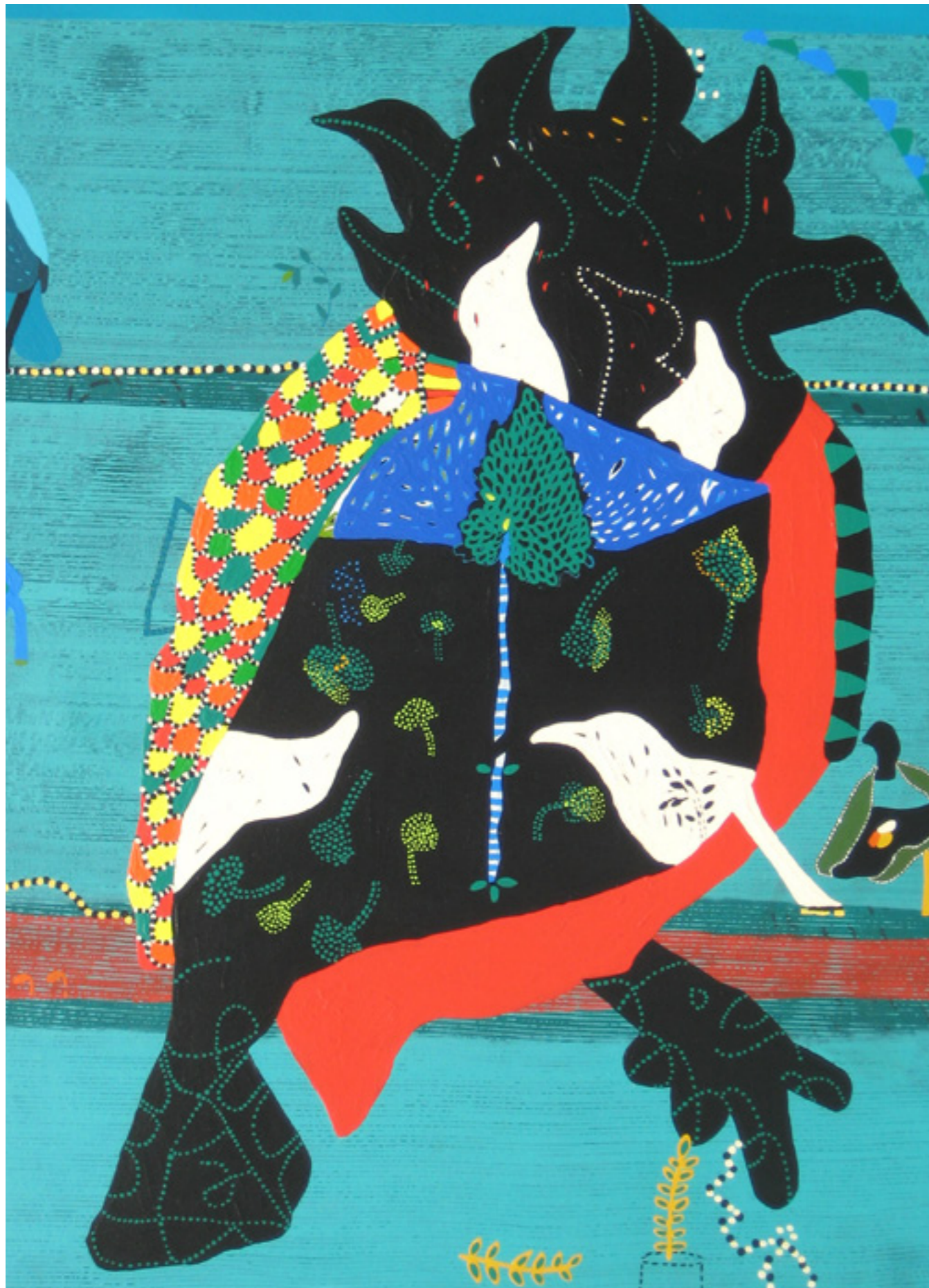
DHANESHWAR SHAH BIRDS WITH BIRD , 2009 AKRYL PÅ LÆRRED 81X97 CM