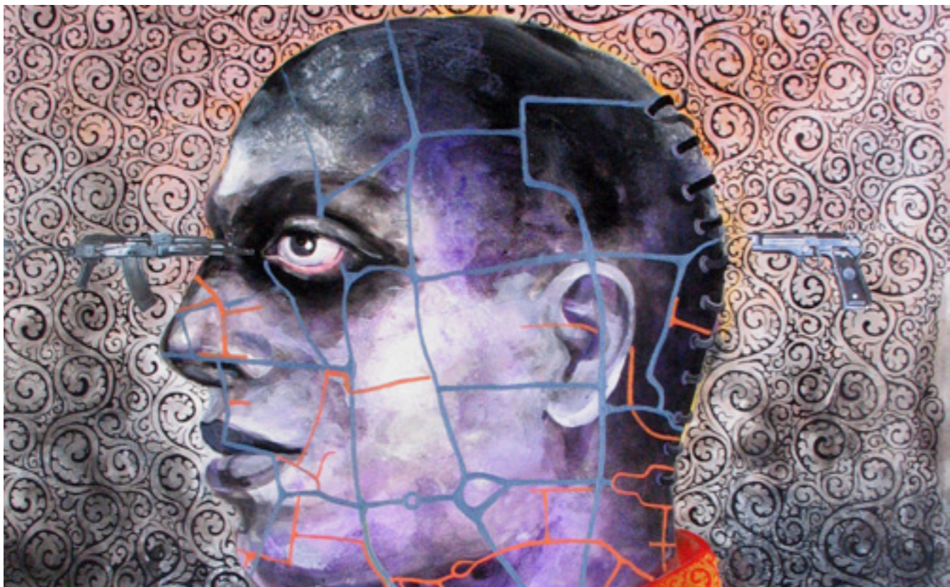
MAHBUBUR RAHMAN STRANGE LOOK , 2009 AKRYL PÅ LÆRRED 89X97 CM