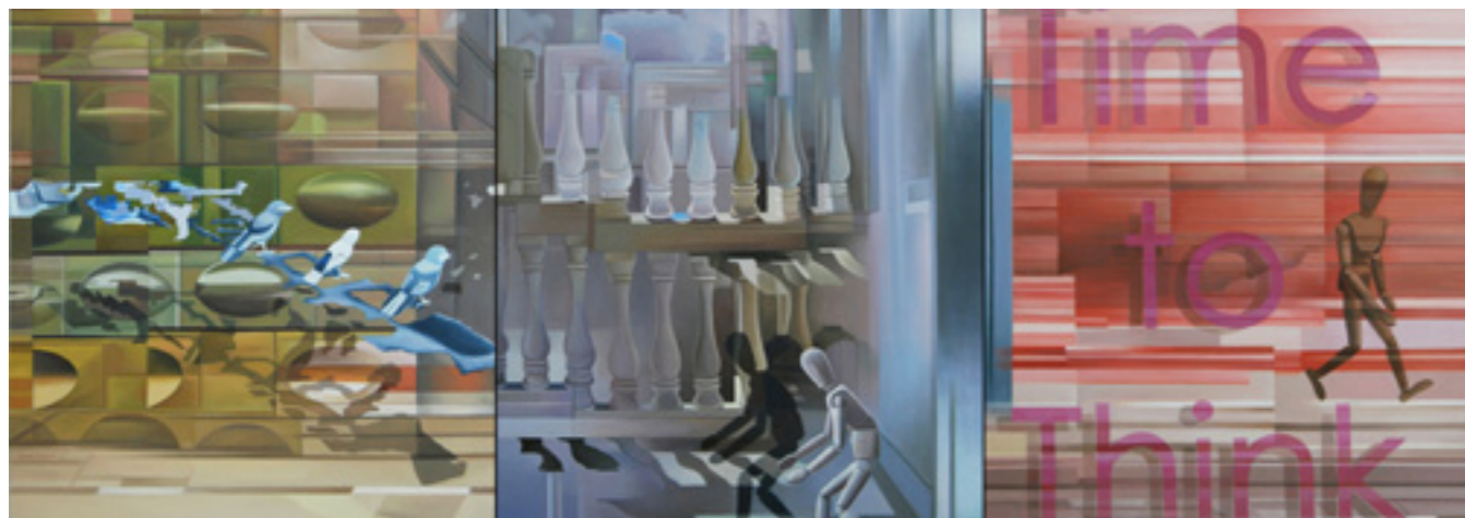
JOYDIP SENGUPTA TIME TO , 2009 OLIE PÅ LÆRRED 183X76 CM