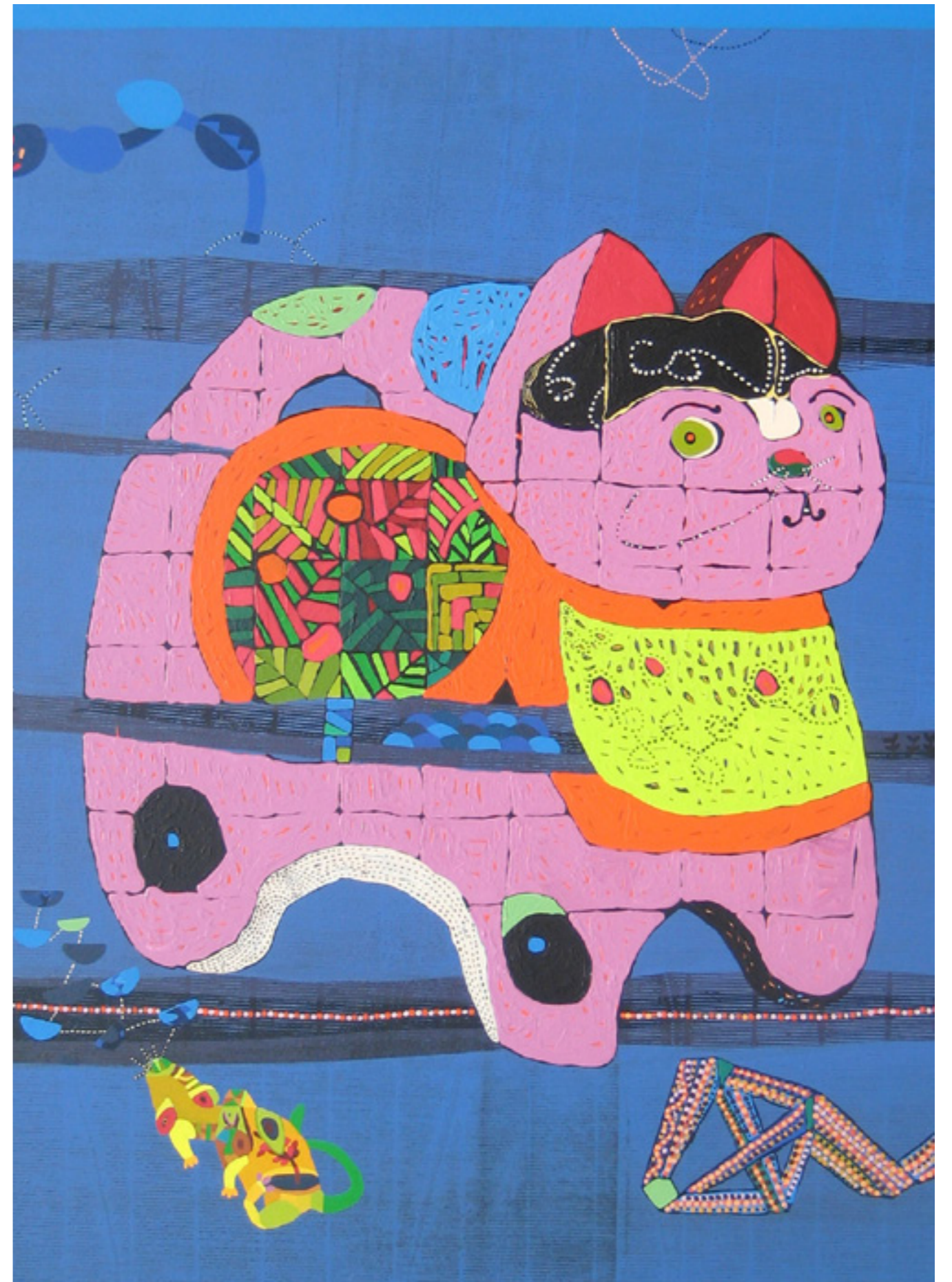
DHANESHWAR SHAH CAT WITH MOUSE , 2010 AKRYL PÅ LÆRRED 122X107 CM