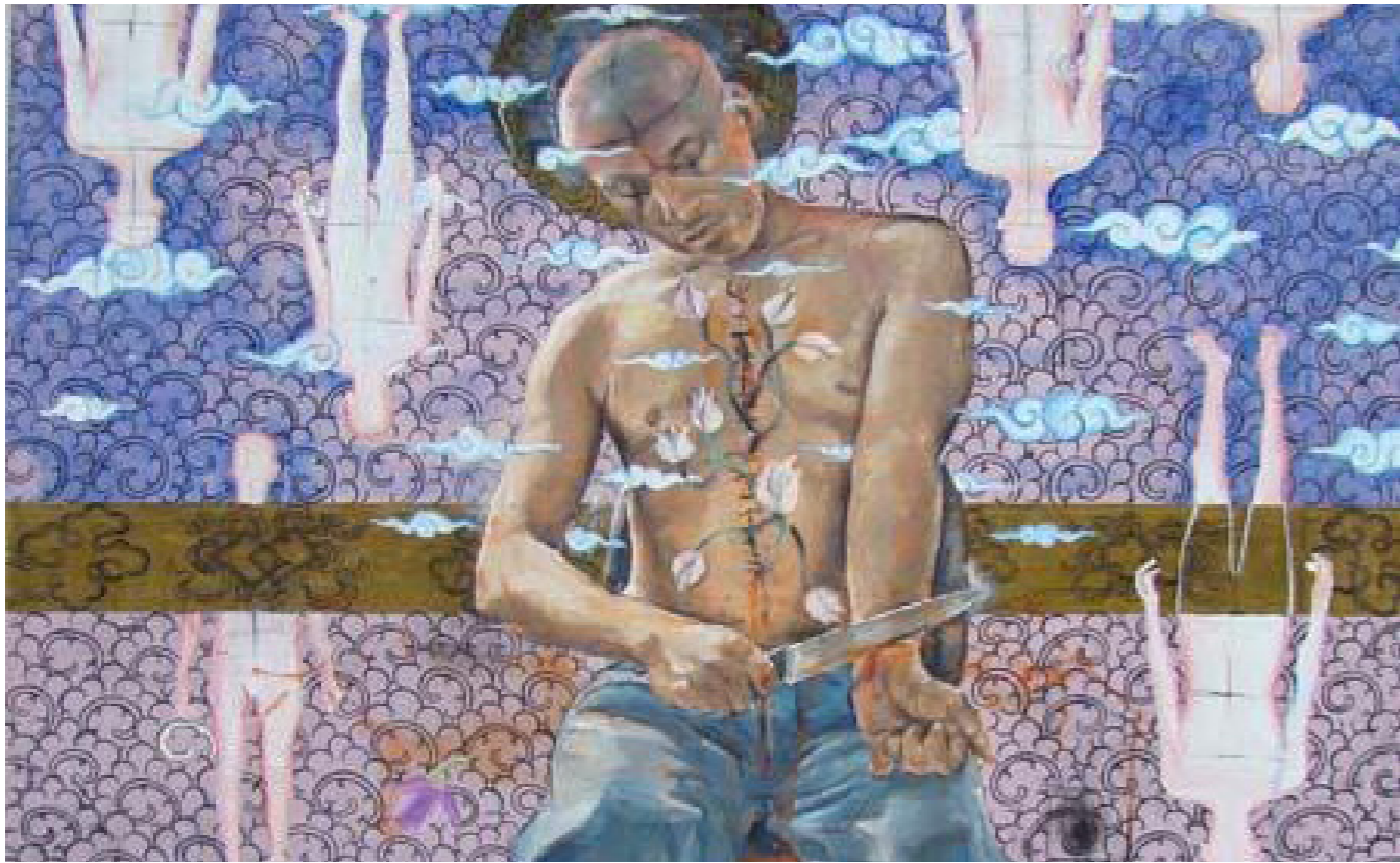
MAHBUBUR RAHMAN KOLKATA , 2009 AKRYL PÅ LÆRRED 92X92 CM