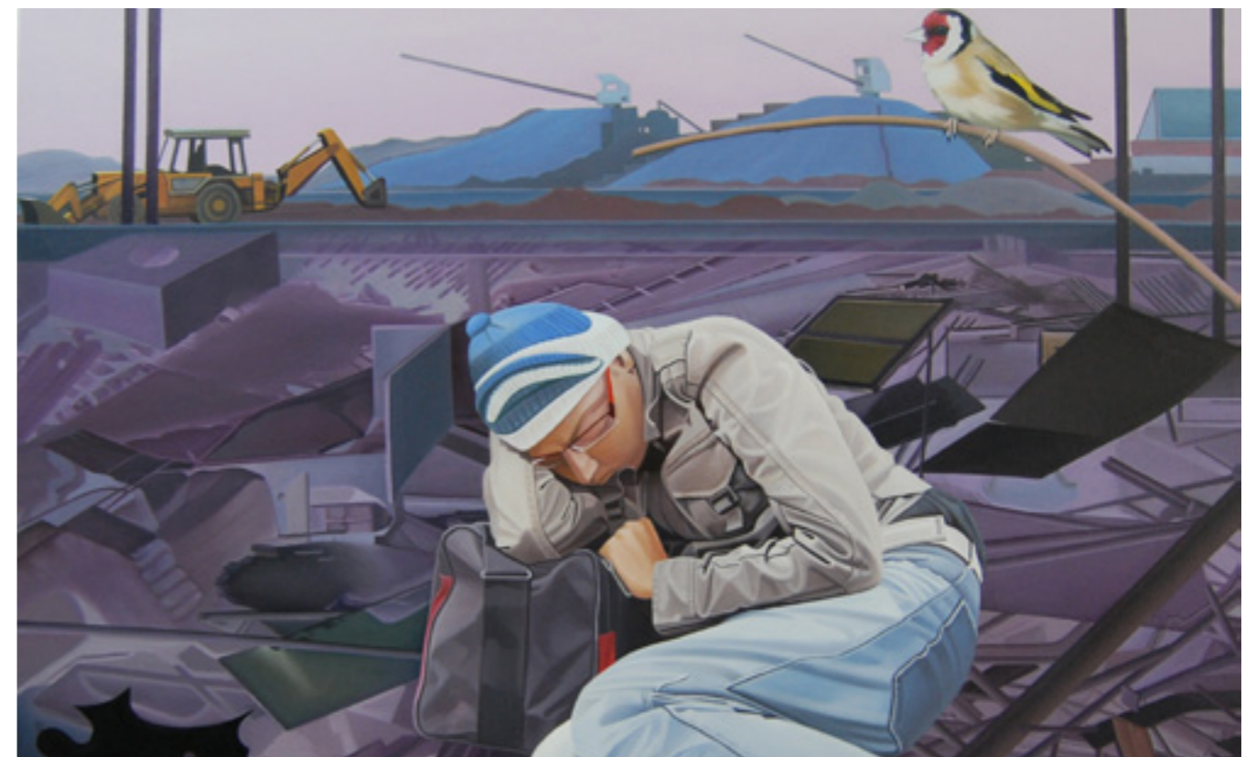
JOYDIP SENGUPTA IN TRANSIT , 2010 OLIE PÅ LÆRRED 107X92 CM