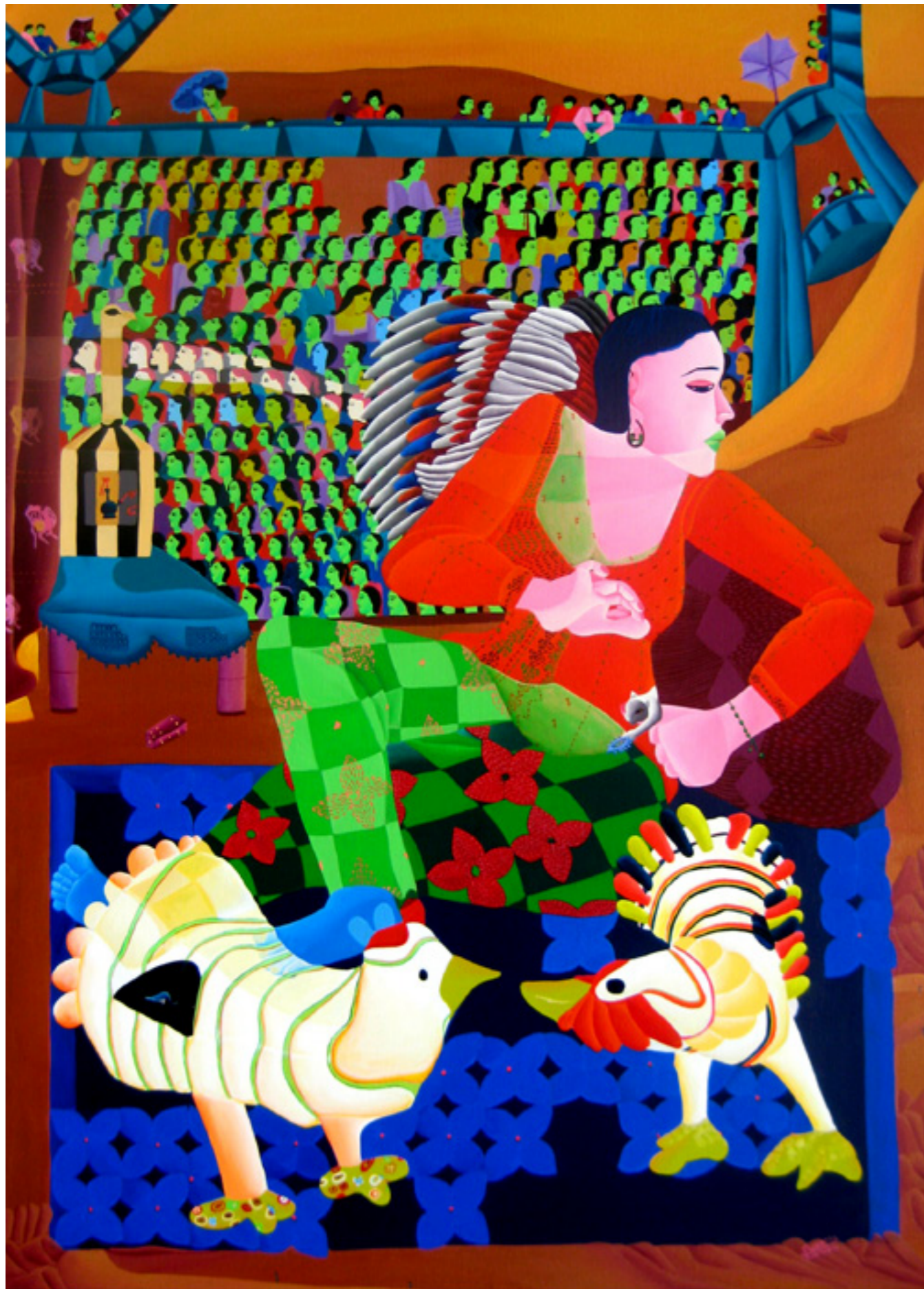
SUNANDA KHAJURIA DECISION MAKER , 2009 AKRYL PÅ LÆRRED 145X107 CM