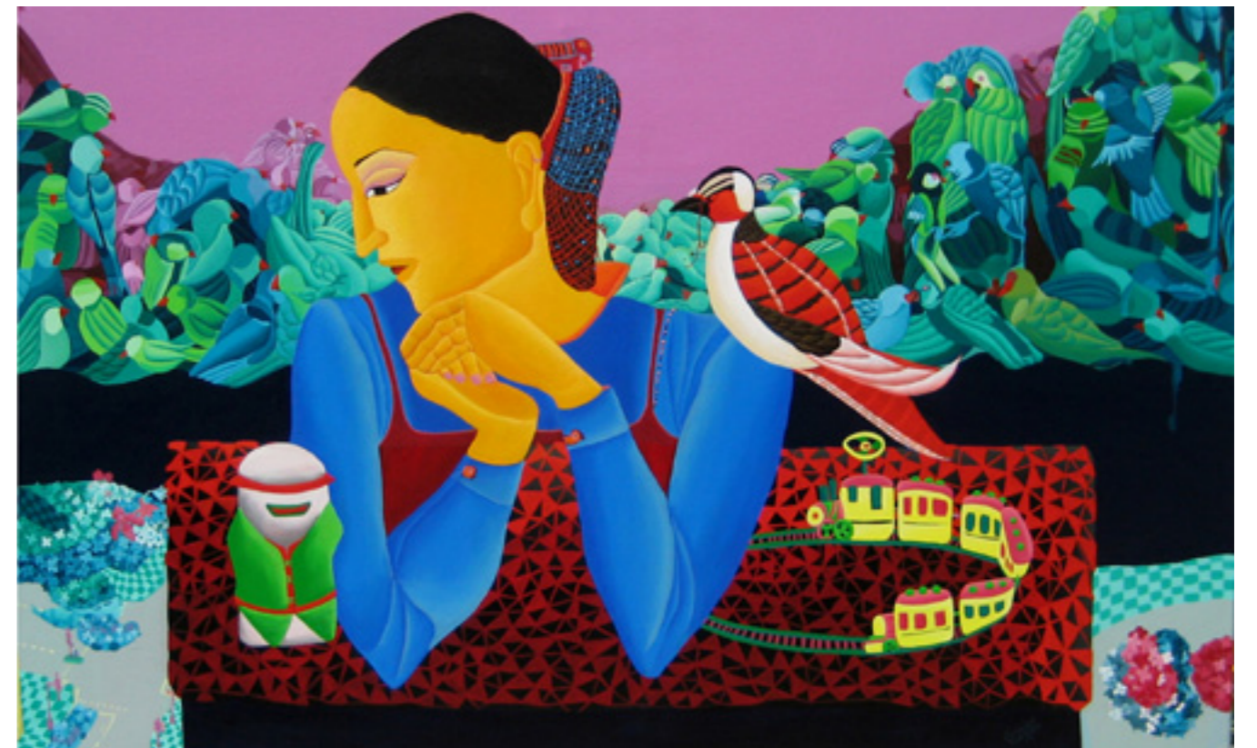
SUNANDA KHAJURIA MOUNTAIN BIRD , 2009 AKRYL PÅ LÆRRED 145X107 CM