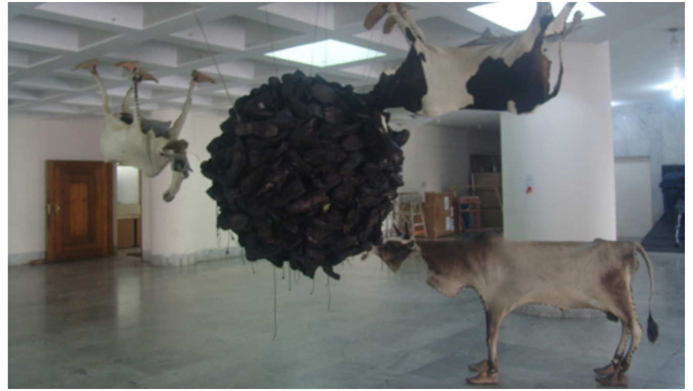
MAHBUBUR RAHMAN WHEN MY BRIEN WAS BLAIND , 2009 INSTALLATION